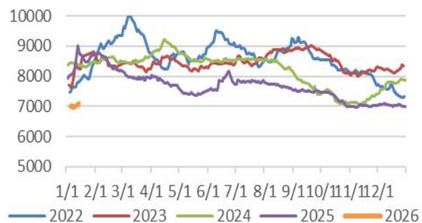
图 9: 山东地炼柴油