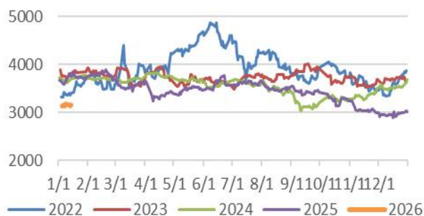
图 2: BU 主力持仓量