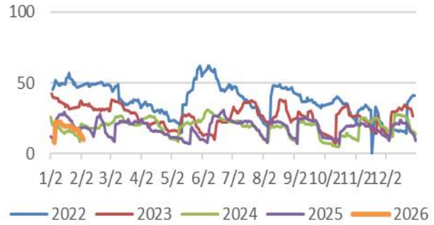
图2: BU主力持仓量 单位: 万手