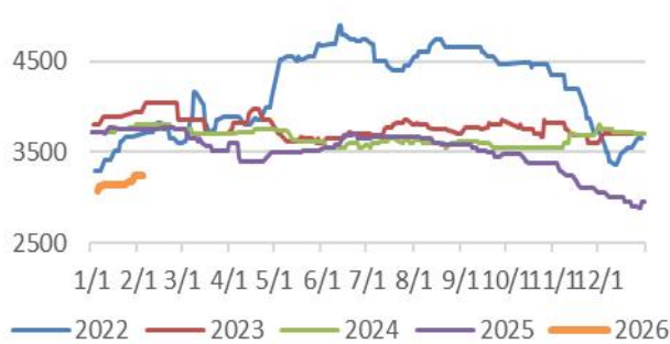
图3: 华东沥青市场价 单位: 元/吨