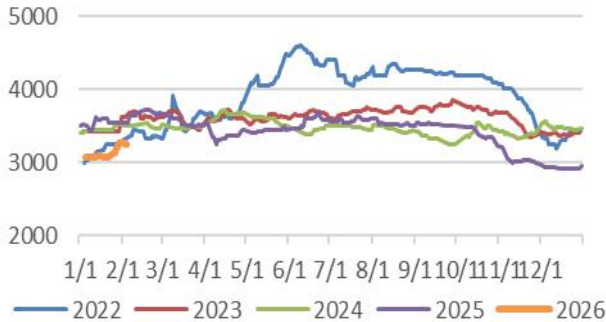
图4: 山东沥青市场价 单位: 元/吨