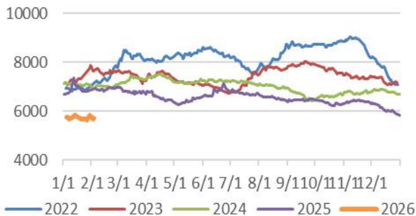
图9: 山东地炼柴油 单位: 元/吨