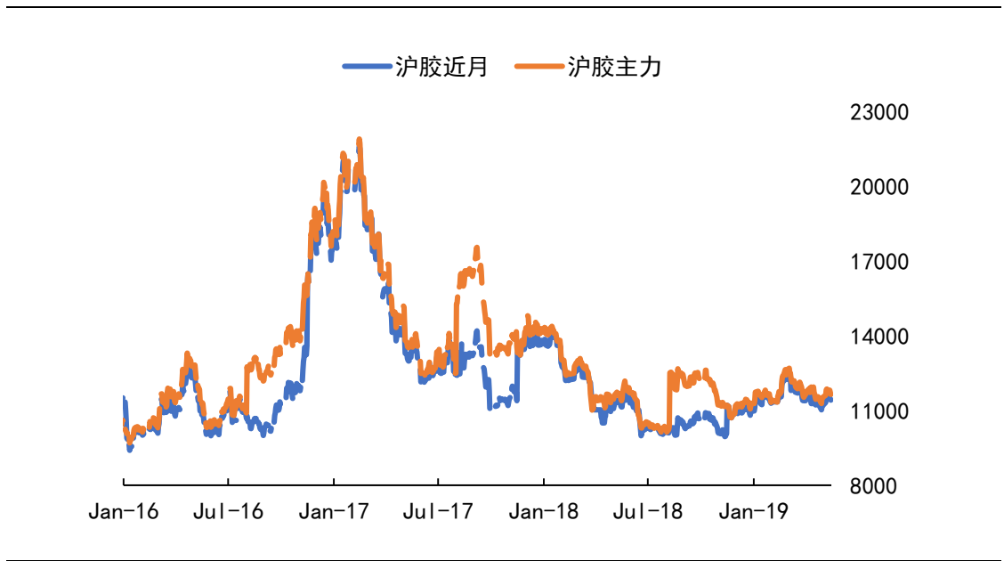
图1 沪胶收盘价折线图